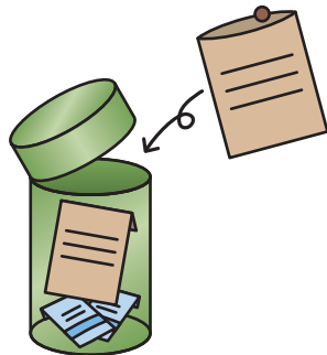
茶筒またはのり缶