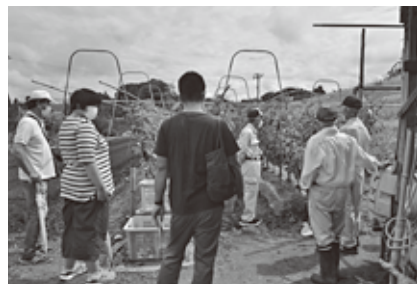
なす栽培見学ツアー

生活指導では組合員の豊かな生活と健康で安心して生活できる地域づくりを目的に女性部活動や生活習慣病健診を行い、また、毎月発行の広報誌で身近な情報や「食」と「農」についての話題を発信しています。