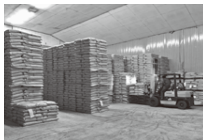
米穀の保管管理を行う農業倉庫

農作業の省力化と農畜産物の品質の向上を図るためカントリーエレベーター、ライスセンター、水稲育苗センター、農産物選果場、堆肥センター等の施設を運営しています。