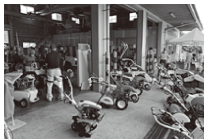
農機センター展示会を各地で開催

農業生産に必要な肥料・農薬・農機具等のほか、暮らしに必要な生活用品等を組合員はじめ地域の皆さまに提供するための事業を展開しています。組合員メリットの充実を目的として組合員カードを利用した購買事業での割引を、給油所・グリーンセンター・Aコープで特定日に行っています。