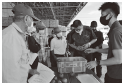
トマト出荷目揃い

また、地域で生産された農畜産物を市場に出荷するほか、契約出荷等により「東美濃ブランド」の確立に取り組んでいます。