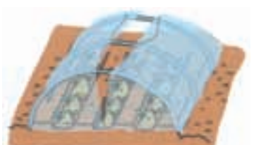
狭幅フィルムを2枚合わせて掛け、 頂部を開き換気する