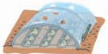
育つにつれて穴開け換気 ⇒ 裾開け換気へ