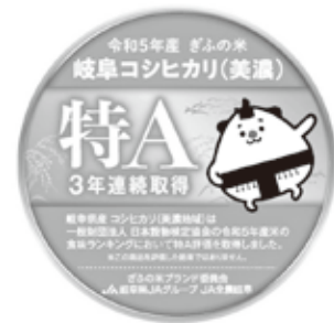
美濃コシヒカリ3年連続「特A」マーク

また、地域で生産された農畜産物を市場に出荷するほか、契約出荷等により「東美濃ブランド」の確立に取り組んでいます。