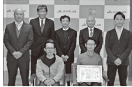
東美濃夏秋トマト研修制度修了

生活指導では組合員の豊かな生活と健康で安心して生活できる地域づくりを目的に女性部活動や生活習慣病健診を行い、また、毎月発行の広報誌で身近な情報や「食」と「農」についての話題を発信しています。