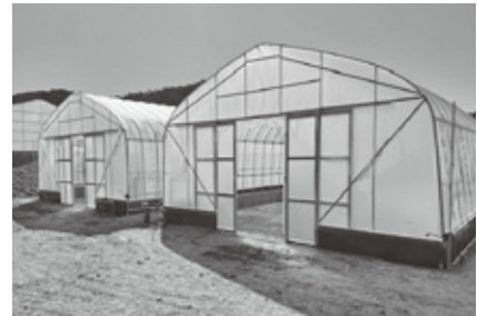
山岡水稲育苗センターで設備を増設

農作業の省力化と農畜産物の品質の向上を図るためカントリーエレベーター、ライスセンター、水稲育苗センター、農産物選果場、堆肥センター等の施設を運営しています。