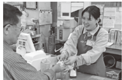
組合員カードによる割引の実施

農業生産に必要な肥料・農薬・農機具等のほか、暮らしに必要な生活用品等を組合員はじめ地域の皆さまに提供するための事業を展開しています。組合員メリットの充実を目的として組合員カードを利用した購買事業での割引を、給油所・グリーンセンター・Aコープで特定日に行っています。